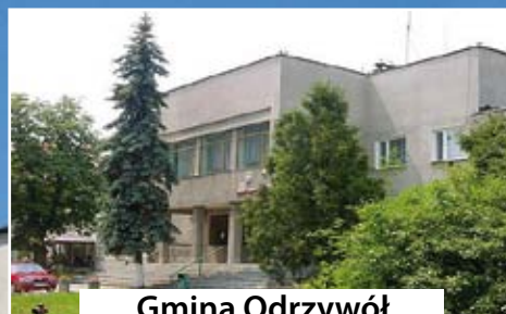
Gmina Odrzywół czytaj str. 8