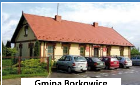
Gmina Borkowice czytaj str. 5