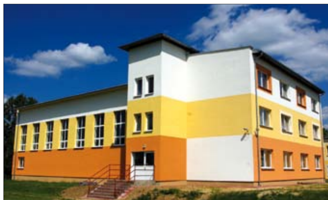
Nowy budynek MOW Kolonia Ossa