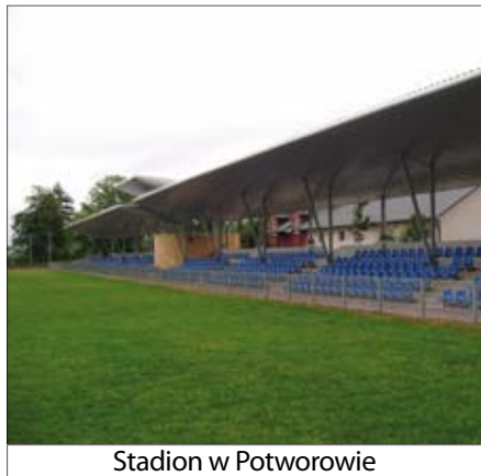
Stadion w Potworowie

Gmina Potworów jako jedyna gmina powiatu przysuskiego znalazła się w rankingu wydatków na budowę infrastruktury