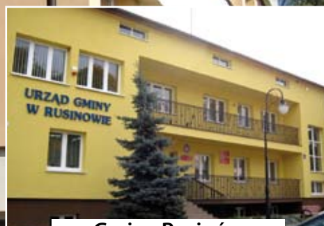
Gmina Rusinów czytaj str. 10