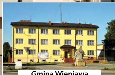
Gmina Wieniawa czytaj str. 11