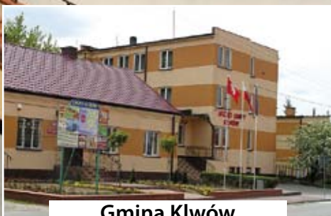
Gmina Klwów czytaj str. 7