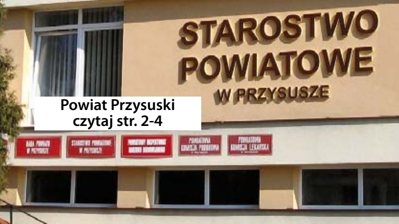
Powiat Przysuski czytaj str. 2-4