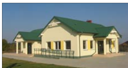
świątelnia wiejska w Wymysłowie