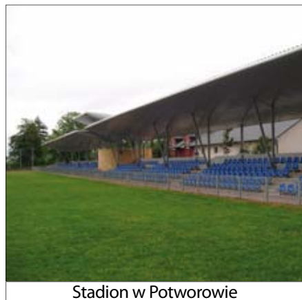
Stadion w Potworowie

Gmina Potworów jako jedyna gmina powiatu przysuskiego znalazła się w rankingu wydatków na budowę infrastruktury