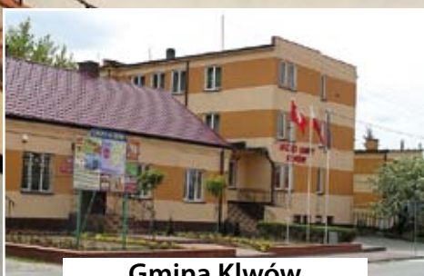
Gmina Klwów czytaj str. 7