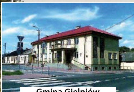
Gmina Gielniów czytaj str. 6