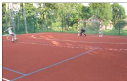
Boisko w Zdonkowie