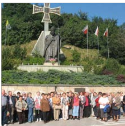
Wycieczka klubu seniora do Sandomierza