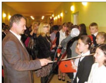
Pasowanie na ucznia szkoły muzycznej

nauki gry w następujących klasach instrumentów: skrzypce,