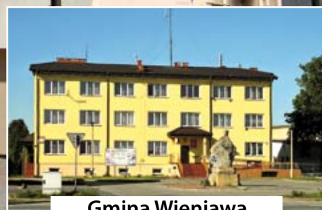
Gmina Wieniawa czytaj str. 11