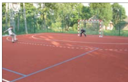
Boisko w Zdonkowie