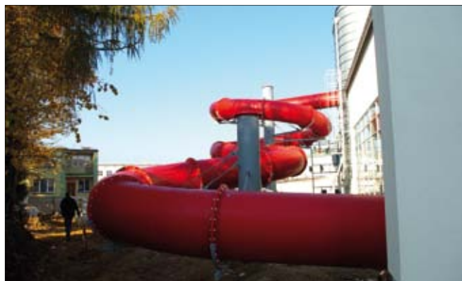
Zjeżdżalnia o długości 63 m