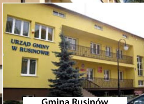
Gmina Rusinów czytaj str. 10