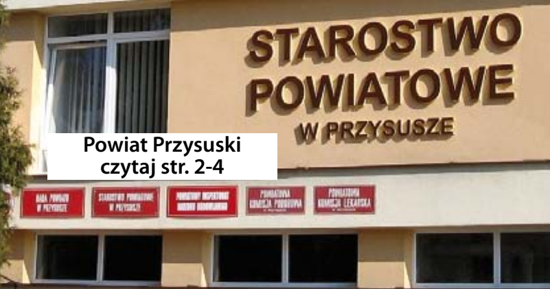
Powiat Przysuski czytaj str. 2-4