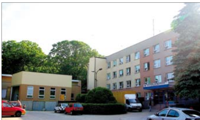
Szpital Powiatowy po przebudowie