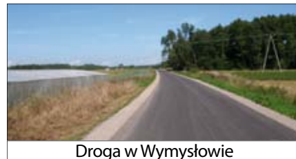
Droga w Wymysłowie

• transporcie (remonty i budowa dróg administrowanych przez samorządy),