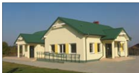
światlica wiejska w Wymysłowie